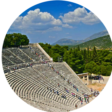
Peloponneso e Grecia continentale